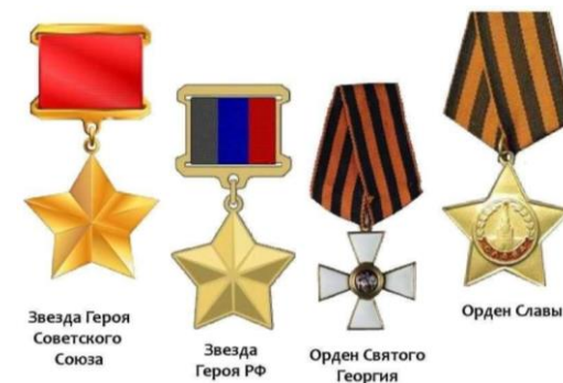
Звезда Героя Советского Союза

В 2007 году российские парламентарии выдвинули идею о возрождении данного праздника (который затем был установлен). Авторы законопроекта пояснили, что возрождение традиции празднования Дня героев – это не только день памяти героическим предкам, но и чествование ныне живущих Героев.